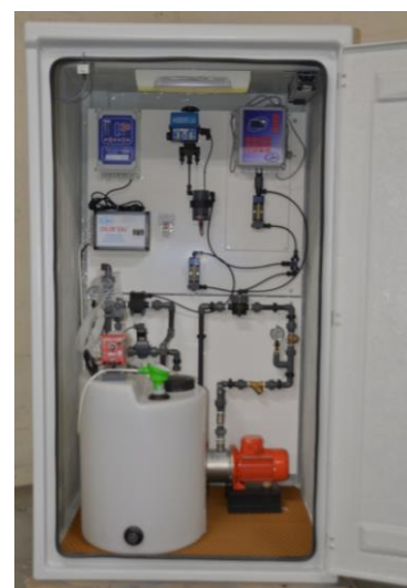
Exemple : Intégration d'un système Chlor'eau et d'une panoplie de chloration Gazeuse