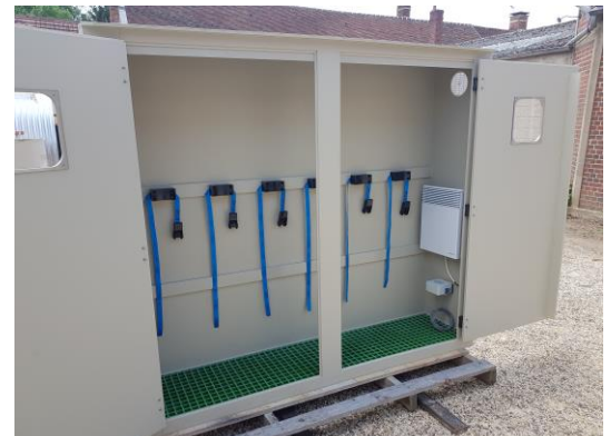
Armoire équipée de râteliers à sangles

Bas de l'armoire avec volume de rétention intégré et caillebotis pour répondre aux exigences de la réglementation française de Décembre 2008 sur les stockages soumis à déclaration.