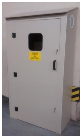
Modèle à porte pour stockage de 3 bouteilles de 30kg ou 2 bouteilles de 49kg, dont 2 en service, triple charnières et double fermeture à clé