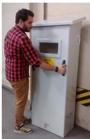
Modèle à capot pour stockage de 2 bouteilles de 30kg ou de 49kg, dont 1 en service, fermeture par cadenas.