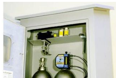
Aménagement intérieur des deux modèles : chaînes de fixation des bouteilles, aérations haute et basse, tablette interne