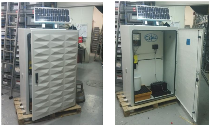
Exemple : Intégration d'un ensemble CIFEC Stéréconome 12 volts avec batterie et panneau solaire.

Ces modèles sont à poser au sol, ils n'ont pas besoin d'être adossés à un mur